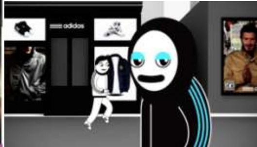
Mood Board Adidas Event